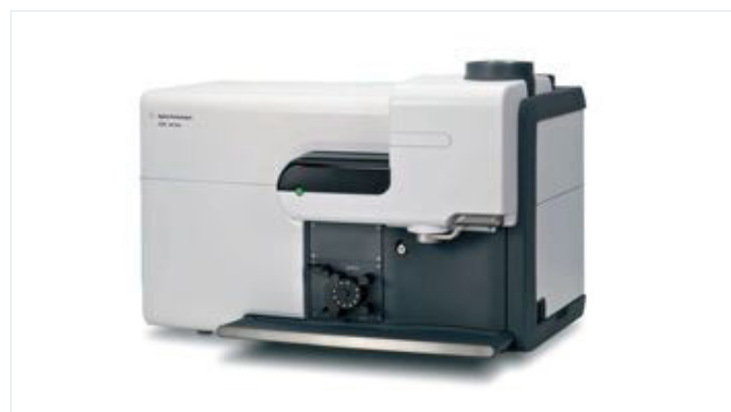
Agilent 4200 (4210) МП-АЭС

определения содержания неодима и алюминия, который не подразумевает разрушения органической матрицы на стадии подготовки проб. Подготовка пробы включает только процедуру разбавления, проводимую в инертной атмосфере. Применение спектроскопии с ионизацией элементов в СВЧ-плазме может служить альтернативой существующим методам в этой отрасли. Примером такого спектрометра является 4200 (4210) МП-АЭС компании Agilent. Данный подход позволяет существенно снизить затраты на проведение анализа, поскольку в качестве плазмообразующего газа выступает азот воздуха. Источником газа является генератор со встроенным компрессором, что упрощает обслуживание прибора и обеспечивает безопасность эксплуатации, по сравнению с другими спектральными методами.